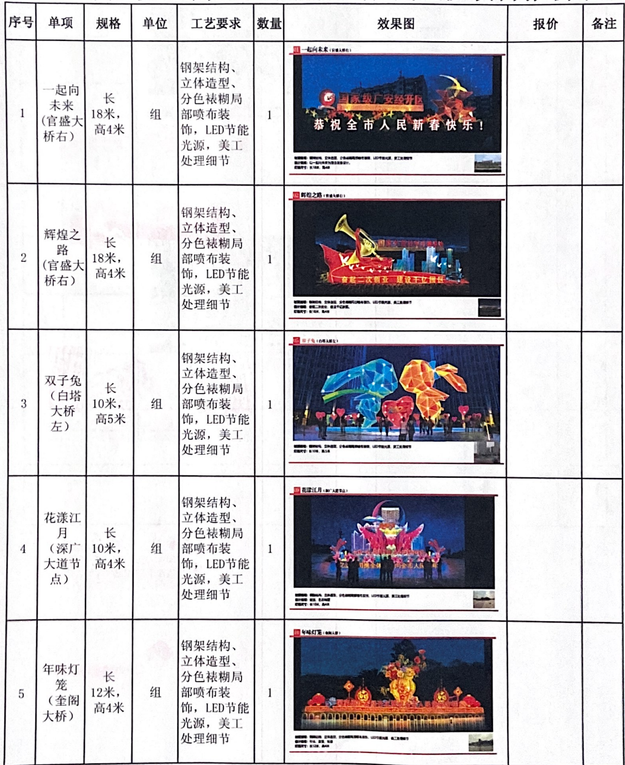
2023年广安经开区奎阁片区春节光彩项目报价表